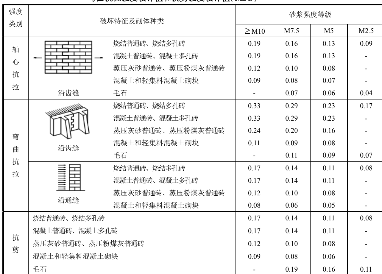
表 3.4.2 沿砌体灰缝截面破坏时砌体的轴心抗拉强度设计值、 弯曲抗拉强度设计值和抗剪强度设计值(MPa)